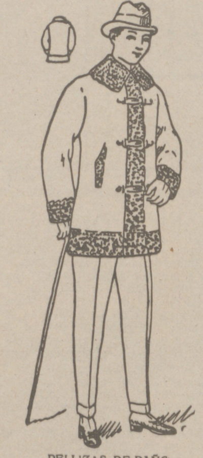
PELLIZAS DE PAÑO desde 20 a 100 pesetas La casa que más surtido tiene y más barato vende