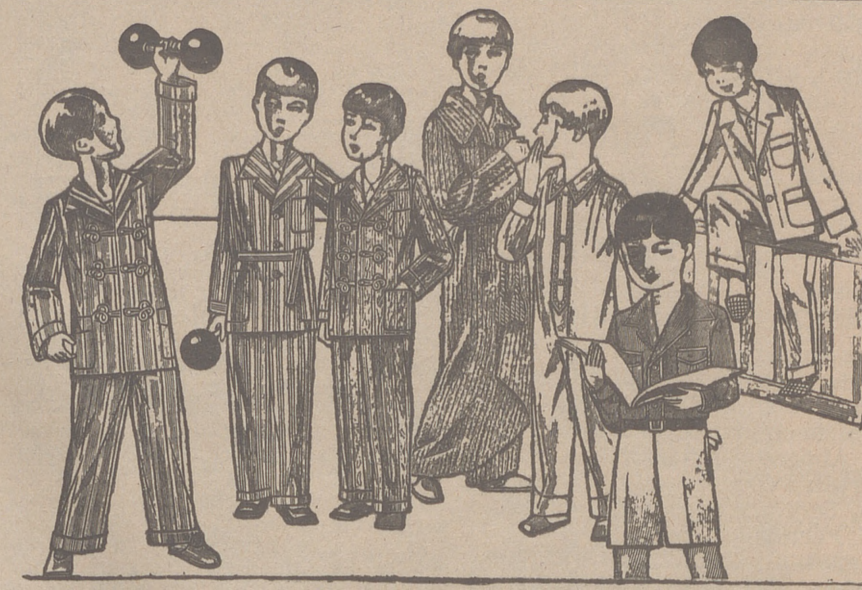
Pijamas y enterizos de percal, cretonas y popelín, de 4 a 10 años, a 6, 7, 8 y 10 pts. La casa que más barato vende y más surtido presenta.

forma de pago _____ (contado o plazos?) En el caso de abonar a plazos ¿qué regalo desea? _____ indique el regalo número 1, 2 o 3.