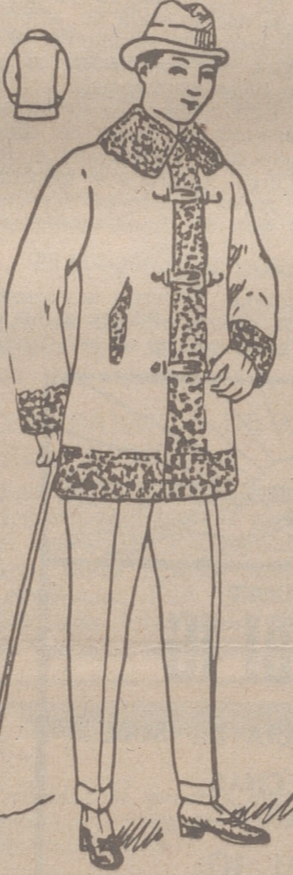
PELLIZAS DE PAÑO desde 20 a 100 pesetas La casa que más surtido tiene y más barato vende

La experiencia demuestra que los chocolates y dulces de MATIAS LOPEZ SON LOS MEJORES DEL MUNDO Pedidos en todos los ultramarinos y confiterías