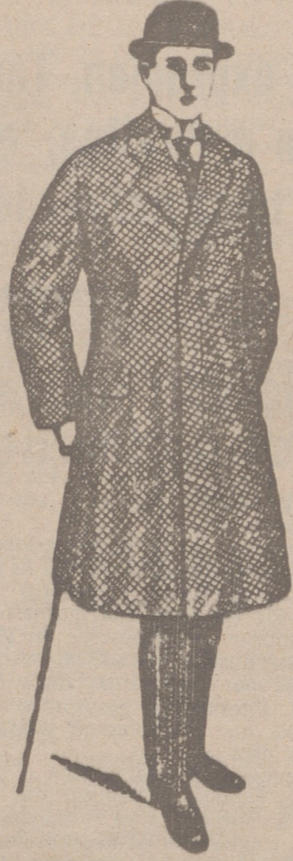
GABANES PARA CABALLERO a 55, 40, 50, 70, 90 y 100 pesetas

PLAZA MAYOR, 42 LAIN CALVO 9 Y 11 BURGOS