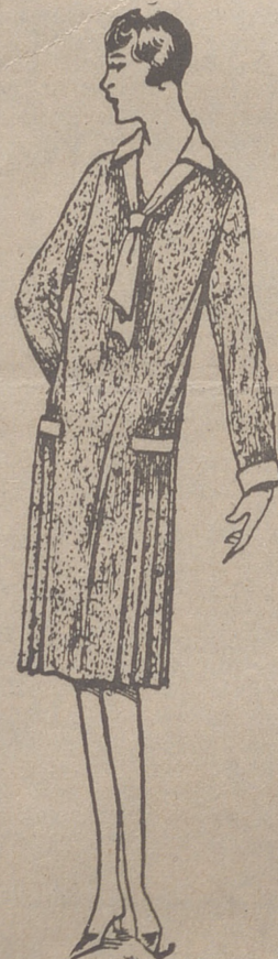
Vestidos de crepón, seda y en lana, colores novedad, a 20, 25, 30 y 40 pesetas