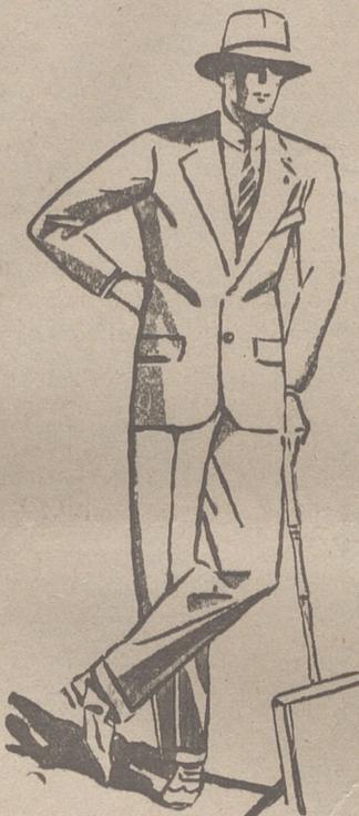
TRAJES DE PANO. CORTE MODERNO de 45 a 180 pesetas

PLAZA MAYOR, 42 LAIN CALVO 9 Y 11 BURGOS