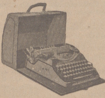
Máquinas de escribir