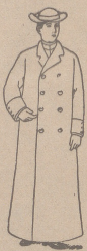
Guardapolvos en satén, gabardina o dril, de 16 a 25 pesetas.

PLAZA MAYOR, 42 LAIN CALVO 9 Y 11 BURGOS