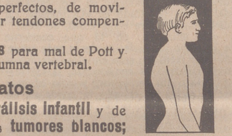
MAL DE POTT