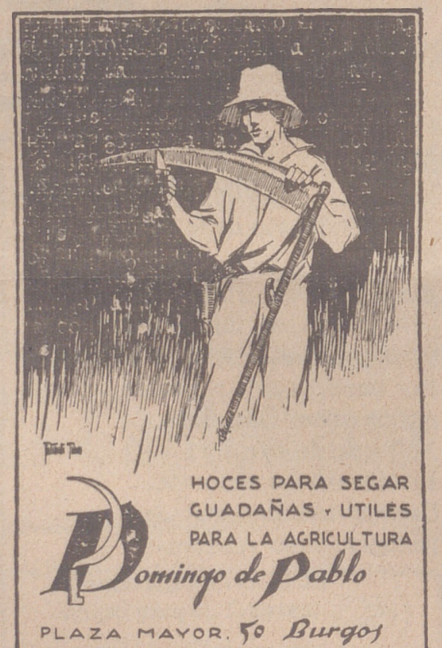
HOCES PARA SEGAR GUADAÑAS - UTILES PARA LA AGRICULTURA

le protegerá su vida de los inminentes peligros a que puede exponerle una HERNIA, descuidada o mal contenida.