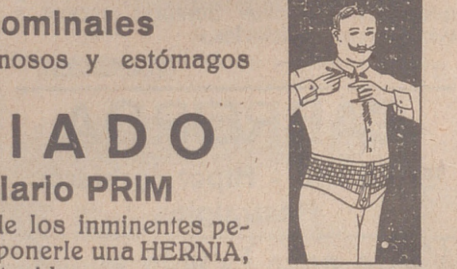
FAJA DE CABALLERO