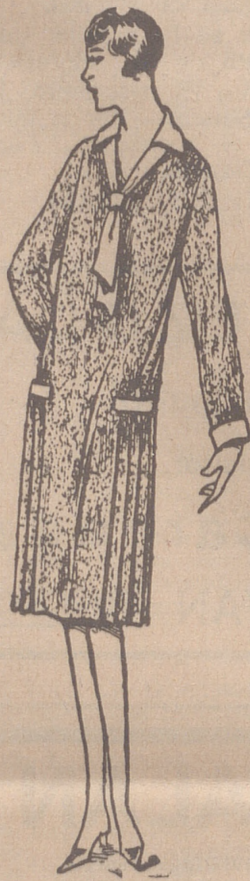
Vestidos de crepón, seda y en lana, colores novedad, a 20, 25, 50 y 40 ptas