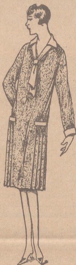
Vestidos de crepón, seda y en lana, colores novedad, a 20, 25, 30 y 40 ptas