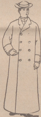
Guardapolvos en setén, gabardina o dril, de 16 a 28 pesetas.

Casa Munguía PLAZA MAYOR, 42 LAIN CALVO 9 Y 11 BURGOS