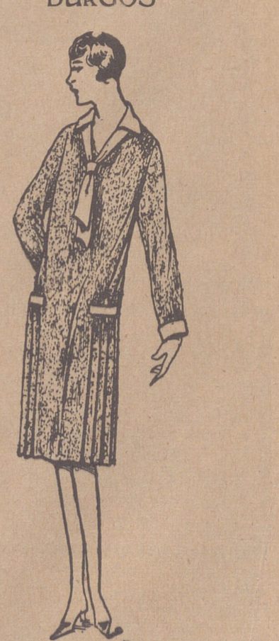
Vestidos de crepón, seda y en lana, colores novedad, a 20, 25, 30 y 40 ptas

PLAZA MAYOR, 42 LAIN CALVO 9 Y 11 BURGOS