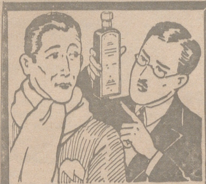
Sólo con desprecio trata usted su resfriado si no prefiere lo trata con la SOLUCION PAUTAUERBERG, que facilita la expectoración y aumenta el apetito y las fuerzas.

Se establece la incompatibilidad del cargo con el de consejero de la Compañía y con el de miembro del comité directivo de la misma.