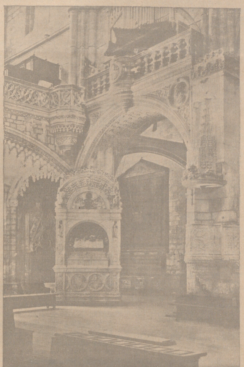
Un aspecto de la iglesia de San Esteban después de su restauración