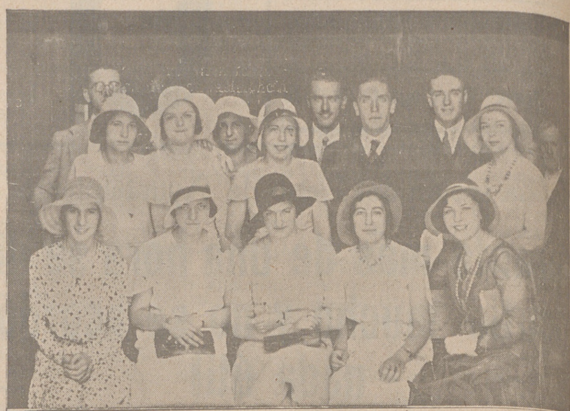
Un grupo de bellas y distinguidas concurrentes a la boda Moral-Tudanca

tierra y telegrafiar a esta Corporación así como al alcalde de Santander dando las gracias por el interés que han demostrado en este asunto.