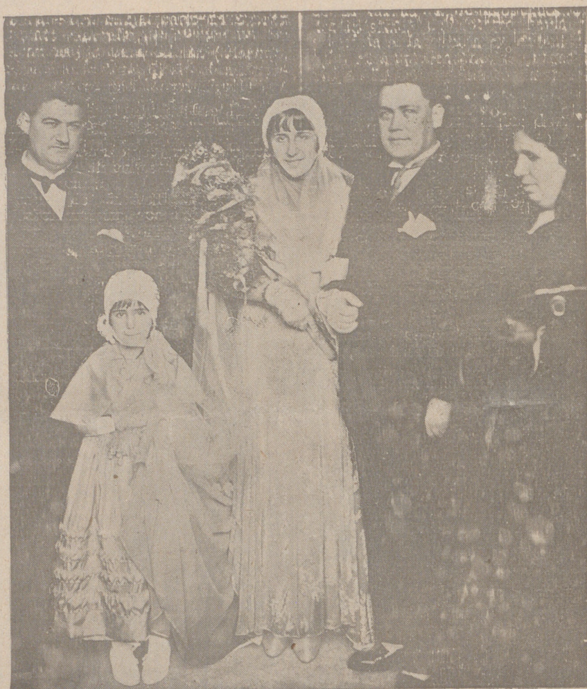
Los recién casados, con sus padrinos, al salir de la Iglesia