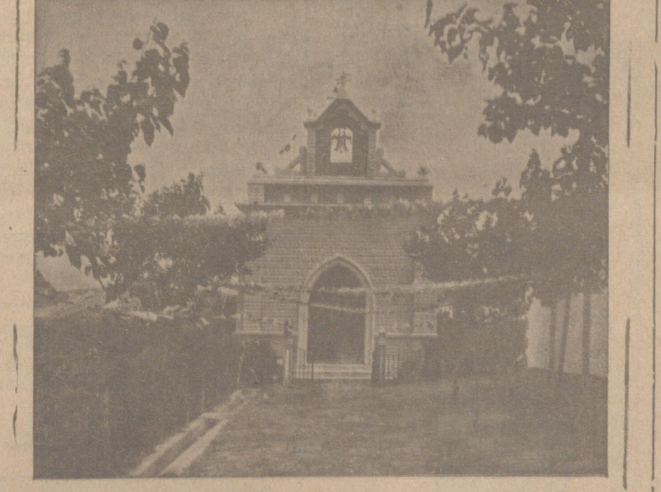
Vista exterior de la capilla inaugurada

Medicina General Consulta de 11 a 1 y de 4 a 6 LAIN-CALVO, 59, 1.º Teléfono, 333