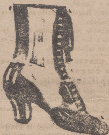
Gran surtido en todas clases, y sección económica a precios de fábrica.

GRAN BAZAR DE CALZADO EMILIANO DOMINGO Mercado, núm. 10.