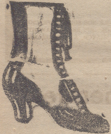
Gran surtido en todas clases, y sección económica á precios de Fábrica.

GRAN BAZAR DE CALZADO EMILIANO DOMINGO Mercado, núm. 10.