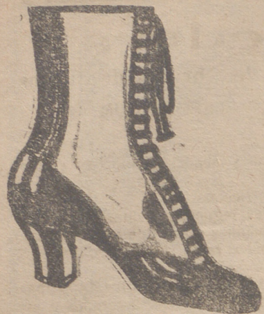
Gran surtido en todas clases, y sección económica á precios de Fábrica.

Representante exclusivo de las mejores Fábricas.