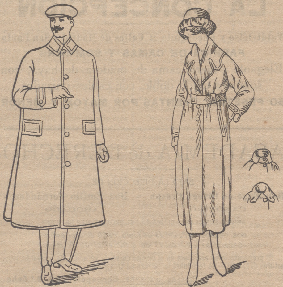
Guardapolvos de caballero, jóvenes y niños, á 9, 10, 15, 20 y 25 pts.

Casa Munguía Escor. de REBOLLO P. Mayor 42, Lain-Calvo 9. Teléfono, núm. 88.—BURGOS.