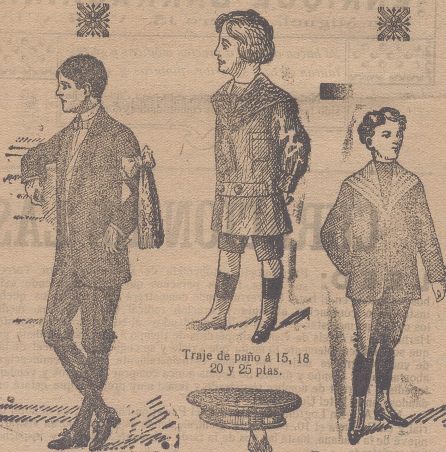
Traje de paño á 15, 18, 20 y 25 ptas.