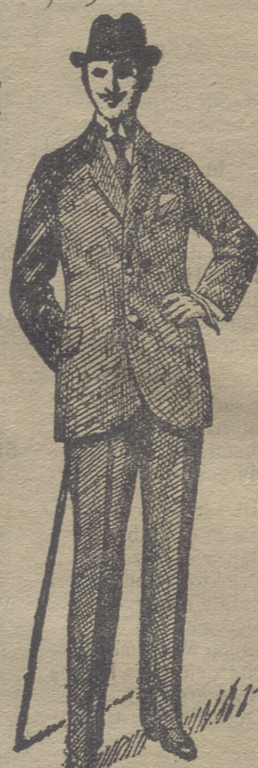
Gabanes de caballero desde 40 pesetas á 125