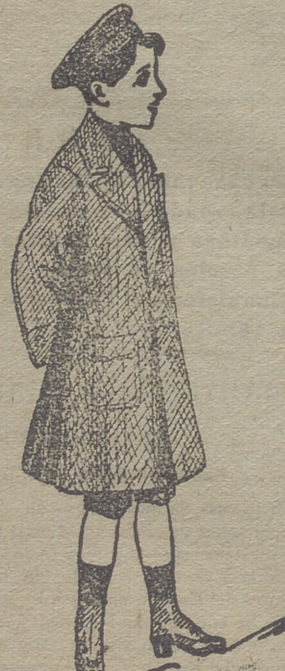
Grandes surtidos recibidos para la temporada en gabanes de jóvenes y niños