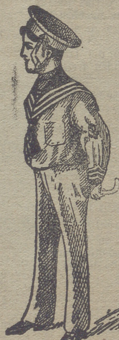
50 modelos diferentes en trajecitos de niños, en paño, vicuñas, gergas y panas. Estos dos modelos son los últimos recibidos para la temporada.