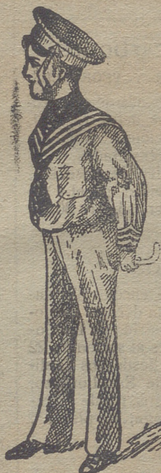
50 modelos diferentes en trajecitos de niños, en paño, vicuña, gergas y panas. Estos dos modelos son los últimos recibidos para la temporada.