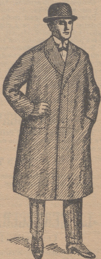
Abrigos gabardina desde 80 ptas. á 150 ptas.

Esta casa presenta siempre grandessurtidos en trajes de caballero, joven y niños y espléndido surtido en toda clase de prendas sueltas para toda clase de trajes.