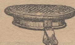
Gorras marineras de Vicuña de 2 50 á 3 y 3 50.