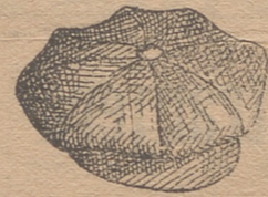
Gorras pana 1'25, 2, 2'50 y 4

Cuellos piqué . . . 0'50 p. id. plancha . . . 0'50 » Puños piqué . . . 0'90 » id. plancha . . . 0'55 » Ligas 0'75, 1'50, 2 y 2'50 » Tirantes. . . 1, 1'50, 2 y 3 »