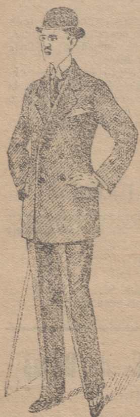
Trajes dril de 25 á 45 ptas. id. paño de 25 á 70 id. pana de 23 á 50

Esta casa presenta siempre grandessurtidos en trajes de caballero, joven y niños y espléndido surtido en toda clase de prendas sueltas para toda clase de trajes.