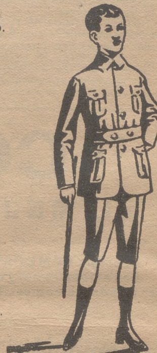
Trajecitos export y forma corriente en paño, pana y dril.

Paños, patentes y panas para encargos, á medida.