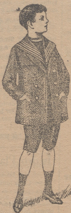
50 modelos diferentes en trajecitos de niños en dril gerga, paño, pana

Americanas azules de 5p. á 15 id. dril de 6 á 20 id. paño de 15 á 30 id. alpaca de 15 á 30 id. pana de 14 á 25