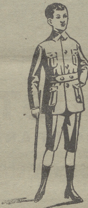
Trajecitos export y ra. forma corriente en paño, paña y dril.

En blanco hay bonitos modelos para la Sgda. Comunión y azos para lo mismo.