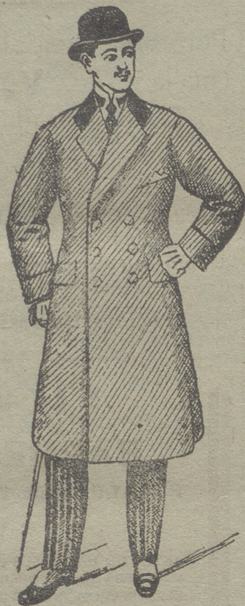
Abrigos gabardina desde 80 ptas. á 150 ptas.

Esta casa presenta siempre grandes surtidos en trajes de caballero, joven y niños y espléndido surtido en toda clase de prendas sueltas para toda clase de trajes.