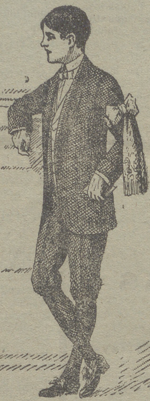
50 modelos en diferentes trajecitos de niño para primera comunión

22 modelos diferentes en abrigos de gabardina impermeabilizados. Abrigos-impermeables de señora. Capitas-impermeables de niños y niñas. Guardapolvos de caballero, señora y niño.