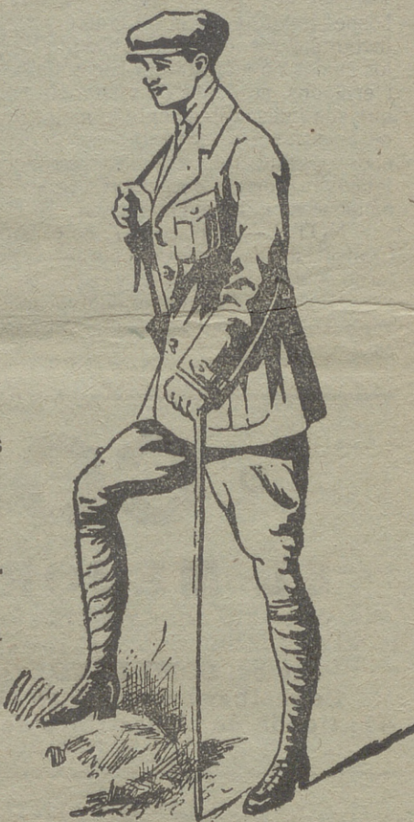
Trajes export en paño, dril y pana.

Ropa blanca de señora y niñas. Camisería, corbatería, tirantes y ligas. Grandes surtidos en lanería y pañería de caballero y señora.