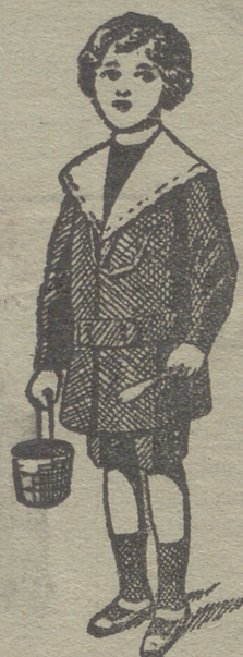
50 modelos diferentes en trajecitos de niños en paño gerga y pana.

Pellizas, capas, mantones, mantitas de seda, tapabocas, mantas de Palencia, género de punto paraguas, guantes, gorras, boinas, calcetines ligas, tirantes, cuellos cauchut, piqué y plancha.