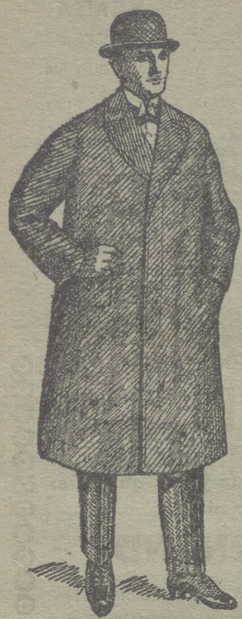
Cabanes de caballero de 30 á 125 ptes.

UNICA CASA QUE PRESENTA GRANDES SURTIDOS EN TEJIDOS Y ROPAS HECHAS DE CABALLERO SEÑORA Y NIÑO