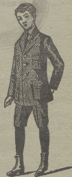
Trajes de jovencitos forma export y corriente en paño, pana y dril.

Rópa blanca de señora y niños, corsés, medias en gasa, seda hilo y algodón, toquillas pelerinas en pelo cabra y lana. Lanería y pañería para señora, paños patentes y panas para caballero