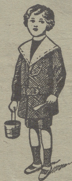
50 modelos diferentes en trajecitos de niños en paño gerga y pana.

pas, mantones, mantillas de seda, tapabocas, mantas de Palencia, género de punto paraguas, guantes, gorras, botinas, calcetines ligas, tirantes, cuellos cauchut, piqué y plancha.