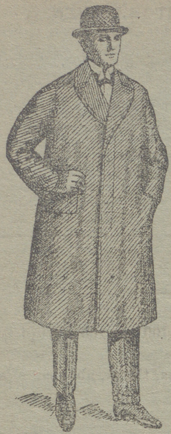
Gabanes de caballero de 30 á 125 ptas.