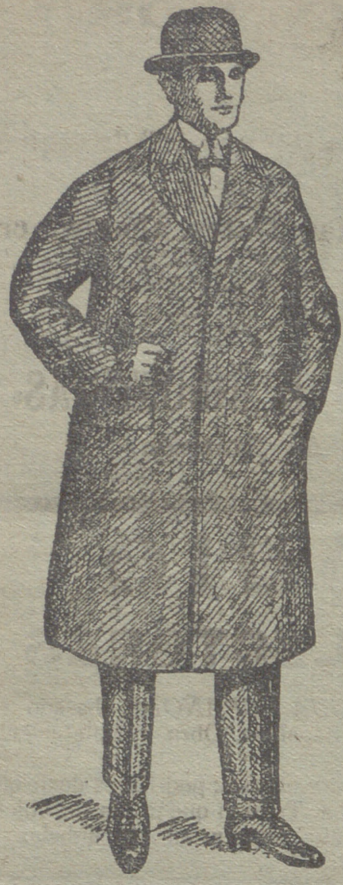
Caberes de caballero de 30 á 125 ptas.

UNICA CASA QUE PRESENTA GRANDES SURTIDOS EN TEJIDOS Y ROPAS HECHAS DE CABALLERO SEÑORA Y NIÑO