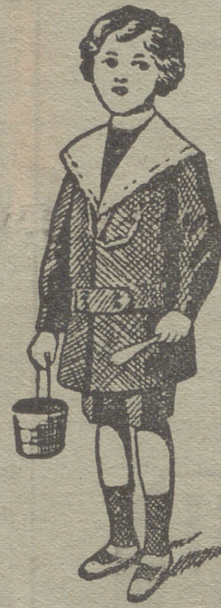
50 modelos diferentes en trajecitos de niños en paño gerga y pana.

pas, mantones, mantillas de seda, tapabocas, mantas de Palencia, género de punto paraguas, guantes, gorras, boinas, calcetines ligas, tirantes, cuellos cauchut, piqué y plancha.