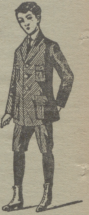
Trajes de juvenitos forma export y corriente en paño, pana y dril.

de señora y niños, corsés, medias en gasa, seda hil y algodón, toquillas p lernas en pelo cabra y lana. Lana fina y pañería para señora, paños patent s y pinas para caballero