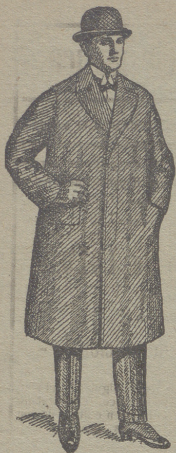
Gabanes de caballero de 30 á 125 ptas.

UNICA CASA QUE PRESENTA GRANDES SURTIDOS EN TEJIDOS Y ROPAS HECHAS DE CABALLERO SEÑORA Y NIÑO