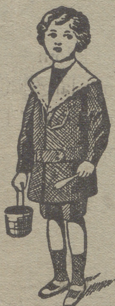
50 modelos diferentes en trajecitos de niños en paño gerga y pana.

:- Guardapolvos de caballero, señora y niños :-