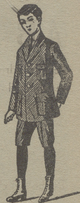
Trajes de jovencitos forma export y corriente en paño, pana y drill.

- - La casa que más surtido presenta - -