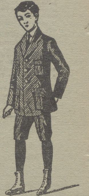
Trajes de jovencitos forma export y corriente en paño, pana y dril.

Rópa blanca de señora y niños, corsés, medias en gasa, seda hilo y algodón, toquillas y perlinas en pelo cabra y lana. Lanería y pañería para señora, paños patentes y panas para caballero