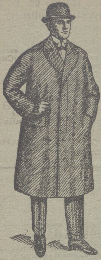
Gabanes de caballero de 30 á 125 ptas.

UNICA CASA QUE PRESENTA GRANDES SURTIDOS EN TEJIDOS Y ROPAS HECHAS DE CABALLERO SEÑORA Y NIÑO