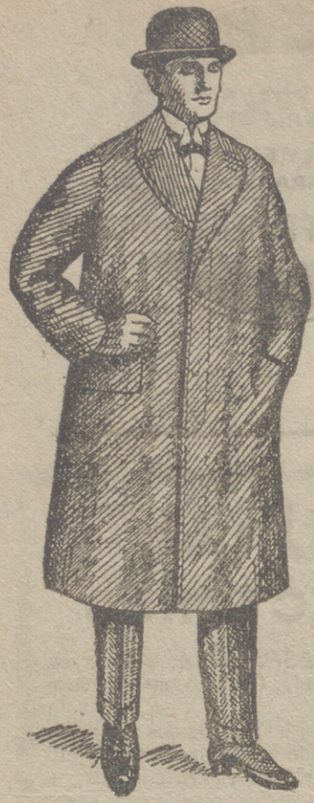
Gabanes de caballero de 30 á 125 ptas.