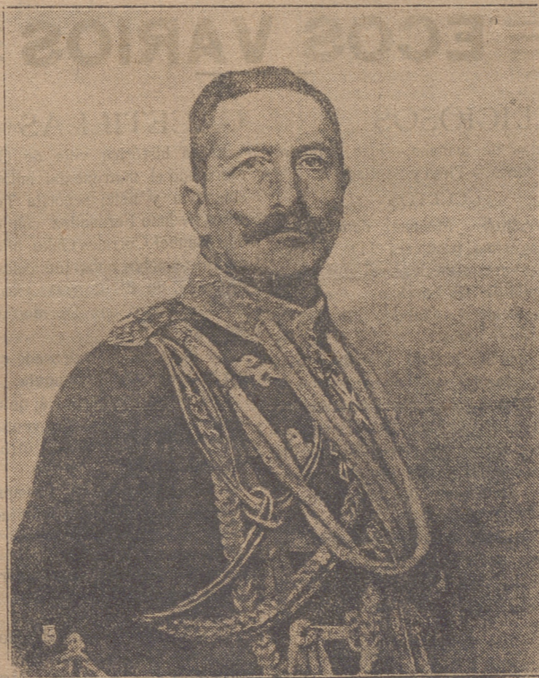
Su Majestad Imperial y Real Guillermo II, de Alemania que mañana celebra su cumpleaños.

Pues bien: entrando en el antiguo Hospital por esa majestuosa puerta principal de la fachada de Oriente, se