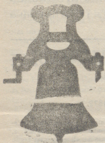
Campana con yugo de hierro de uso solo plaza

Calle de Francia y Portal de Urbina VITORIA (ALAVA)