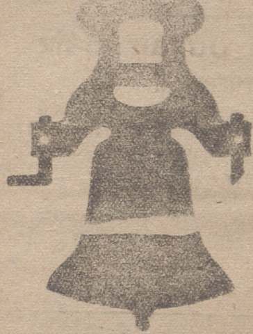
Figura con tipo de hierro de una sola pieza

Esta antigua y acreditada fábrica se halla dotada de maquinaria la más moderna que se conoce y de la mayor precisión, movida por motores eléctricos para la construcción de relojes públicos de todas clases.