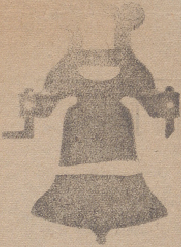
Campana con yugo de hierro de una sola pieza

Calle de Francia y Portal de Urbina VITORIA (ALAVA)