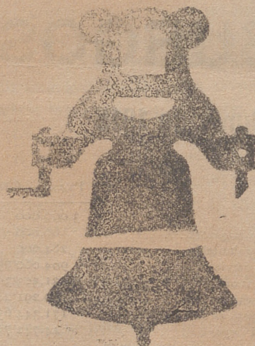
Campana con yugo de hierro de una sola plaza

Tenemos el gusto de exponer a continuación algunas de las obras realizadas en estos últimos años en Burgos y su provincia, á fin de que los que los conocen conozcan esta clase de trabajos, puedan ver palpablemente la superioridad de los productos de esta casa.