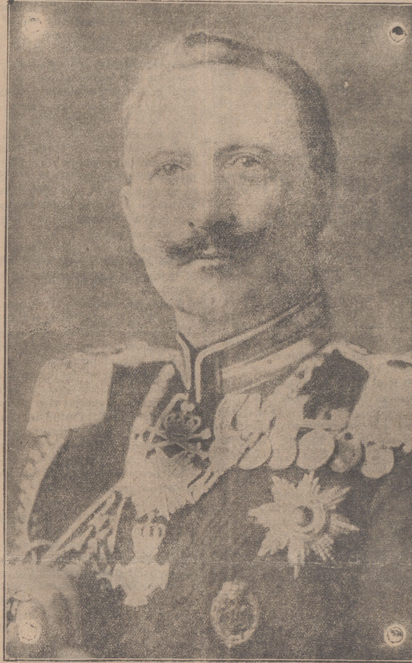
Guillermo II, Emperador de Alemania