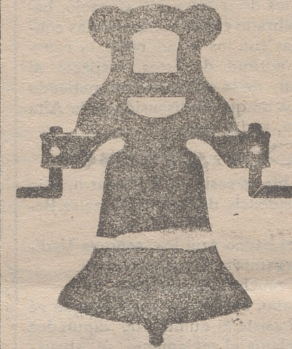
Campana con yugo de hierro de una sola pieza

Calle de Francia y Portal de Urbina VITORIA (ALAVA)