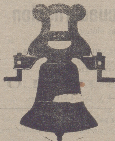
Campana con yugo de hierro de una sola pieza

Tenemos el gusto de expresar á continuación algunas de las obras realizadas en estos últimos años en Burgos y su provincia, á fin de que los que les interese conocer esta clase de trabajos, puedan ver palpablemente la superioridad de los productos de esta casa.