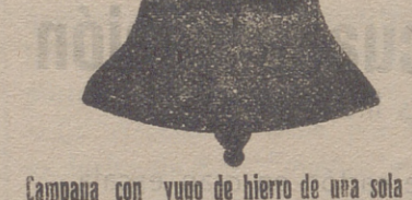
Campana con yugo de hierro de una sola pieza

Calle de Francia y Portal de Urbina VITORIA (ALAVA)