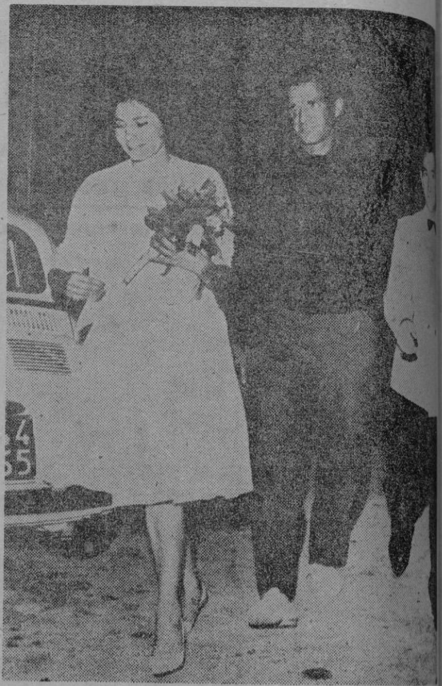
Portofino. — Número sensacional de la famosa ciudad veraniega en la temporada actual es la presencia de la ex-emperatriz Soraya de Persia, que aparece en la fotografía en el momento de salir de un club nocturno. (Foto Europa Press).