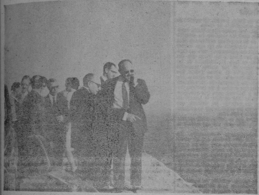
El Ministro de Obras Públicas y séquito durante una de las visitas de inspección realizadas en el día de ayer.

El Sr. Vigón hoy dará por terminada su estancia en la Isla