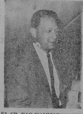
EL SR. DAG HAMMARSKJOELD

LOS PRIMEROS VOLUNTARIOS El Cairo, 25. — Una comisión de la Liga Árabe ha completado los preparativos para el envío del primer contingente de voluntarios árabes a Túnez y ha señalado la fecha para su partida. — Efe