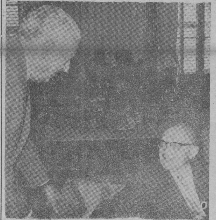
El Sr. Vigón en un momento de las manifestaciones que hizo para nuestro periódico a Jorge Andreu.

Estas son las importantes manifestaciones que nos ha hecho el Ministro de Obras Públicas señor Vigón