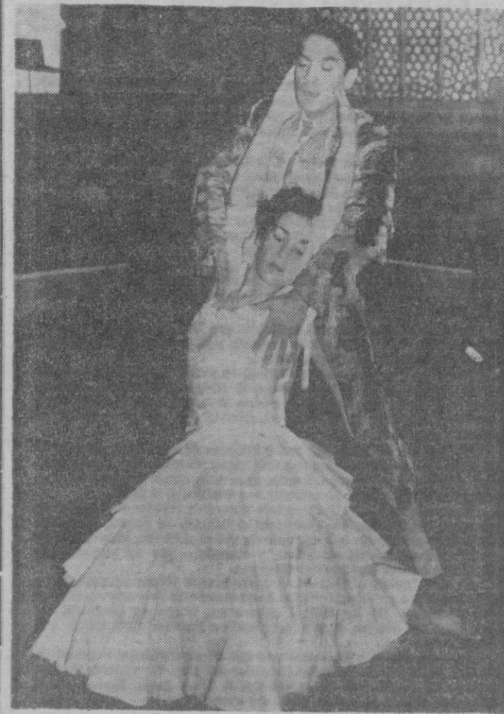
Un momento del ballet «Jugando al toro» que Antonio nos dará a conocer en su próxima actuación en Palma.

Ha sido una auténtica «campanada» el anuncio por la empresa del Teatro Principal de la presentación en su escenario de la primera figura española de la danza, Antonio. Aún muchos no se lo terminan de creer y sin embargo el mundialmente conocido bailarín actuará en cuatro únicas funciones en nuestro primer teatro, a partir del próximo sábado.