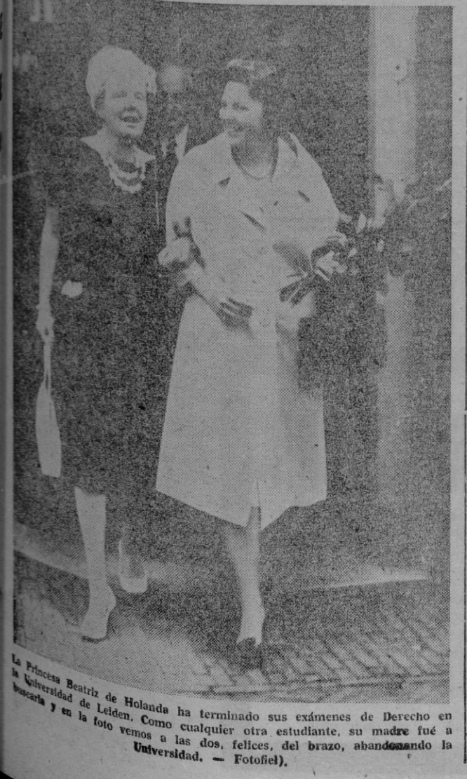
La Princesa Beatrix de Holanda ha terminado sus exámenes de Derecho en la Universidad de Leiden. Como cualquier otra estudiante, su madre fue a la universidad y en la foto vemos a las dos, felices, del brazo, abandonando la Universidad.