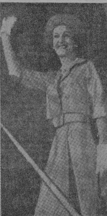
A la izquierda, la señora Kennedy; a la derecha, la señora Nixon. Aunque son rivales políticas, están de acuerdo en aceptar la moda americana y rechazar las creaciones de los grandes modistos parisinos.

día tras el sillón presidencial; Mamie Eisenhower es la matrona magnética de un país que puede considerarse casi en su totalidad como un matriarcado.