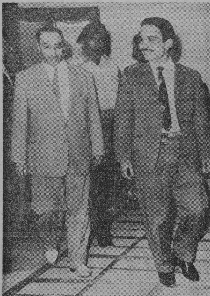
En la foto vemos al Rey Hussein de Jordania llegando a la Casa del Gobierno de Amman para presidir una reunión del gabinete. Le acompaña Teihsuni, el nuevo Primer Ministro, nombrado tras el asesinato de Mhali, Hussein sonríe, pero como se vé claramente en la foto, va bien armado, incluso con una canana con balas a la cintura.