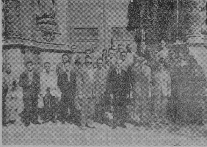
Un grupo de antiguos legionarios, a la salida de San Francisco, después de una misa con motivo del XL aniversario de la fundación de la Legión

Con una misa en la iglesia de San Francisco y un acto de camaradería