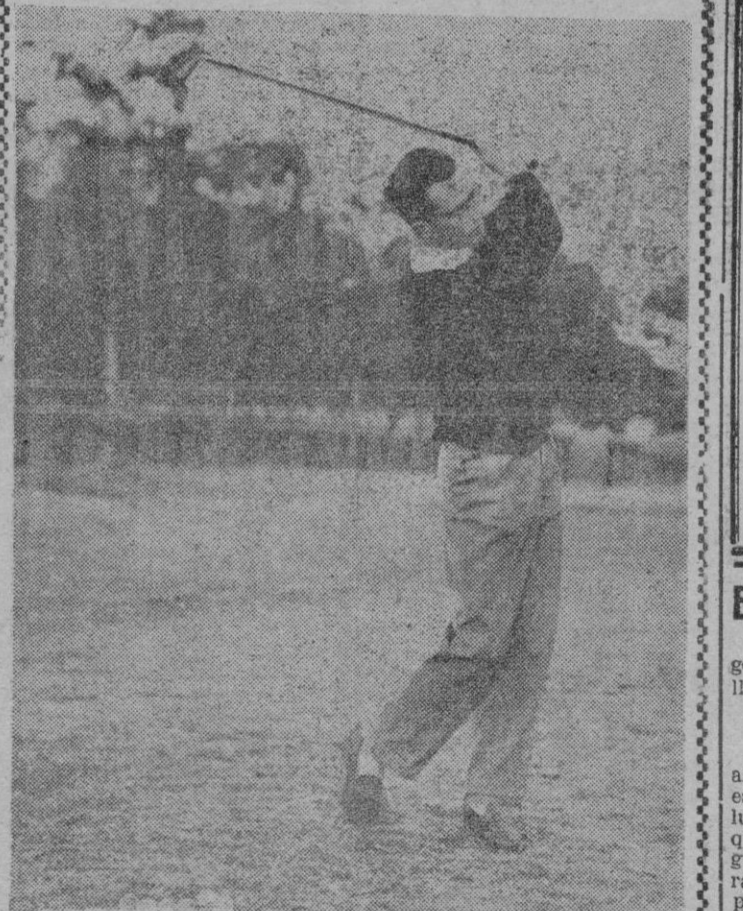
El año pasado circuló esta fotografía de Balduino en la que no se decía dónde había sido tomada. Ahora se dice que fue en Barcelona durante la misteriosa estancia del Rey de los belgas en España.

El baile sirvió para mostrar al mundo la imagen de un Balduino muy diferente del habitual «rei triste» que llenaba las crónicas. Estuvieron presentes un buen ramillete de jóvenes princesas: Beatriz de Holanda, Brigitta de Suecia con su hermana Desirée, María Gabriela de