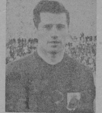
HOLLAUS jero, pero no para esta temporada, sino para la próxima y en la próxima puede o no puede interesar. Vemos nosotros en esta deci-

El Mallorca ha quedado un tanto sorprendido por la actitud de Hollaus. Bien es verdad que quedaría un hueco para otro extranjero.