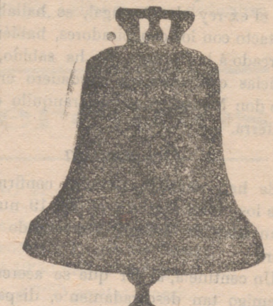
Todas mis campanas suenan la NOTA justa convenientemente construcción esmeradísima ya garantía 10 años.

Única fábrica de su género en España, dotada de maquinaria de gran precisión y motores á vapor y eléctricos; se construyen relojes para iglesias, Casa consistoriales, colegios, cuarteles, etc., etc.