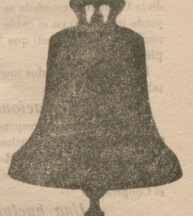
Todas mis campanas suenan la NOTA justa convenientemente esmeradísima ya garantía 10 años.

Se refunden las rotas a precios muy económicos, siendo de mi cuenta los portes de ferrocarril a toda España.