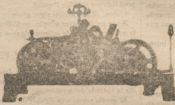
Reloj de ocho días de cuerda tocando horas con repetición y medias

Única fábrica de su género en España, dotada de maquinaria de gran precisión y motores a vapor y eléctricos; se construyen relojes para iglesias, Casa consistoriales, colegios, cuarteles, etc., etc.