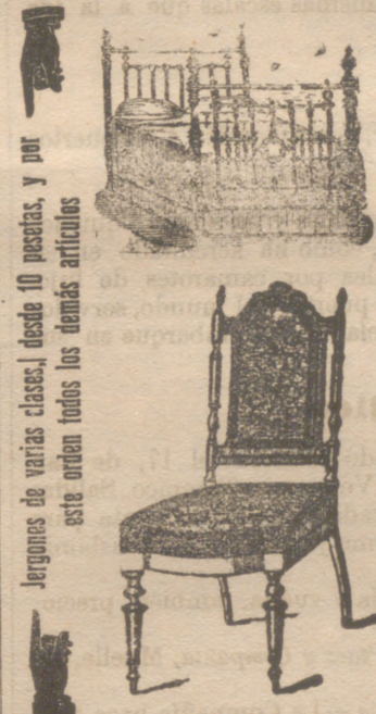
Argones de varias clases, desde 10 pesetas, y por este orden todos los demás artículos

CALLE VITORIA, 22 Y 24, FRENTE AL CUARTEL DE CABALLERÍA Y PRÓXIMO AL «DIARIO DE BURGOS» —BURGOS—