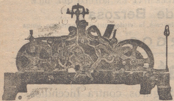
Reloj de ocho días de cuerda tocando horas con repetición y medias