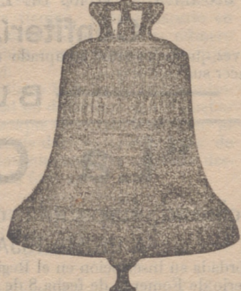
Todas mis campanas suenan la NOTA justa conveanid construcción esmeradísima ya garantía 10 años.

Se refunden las rotas á precios muy económicos, siendo de mi cuenta los portes de ferrocarril á toda España.