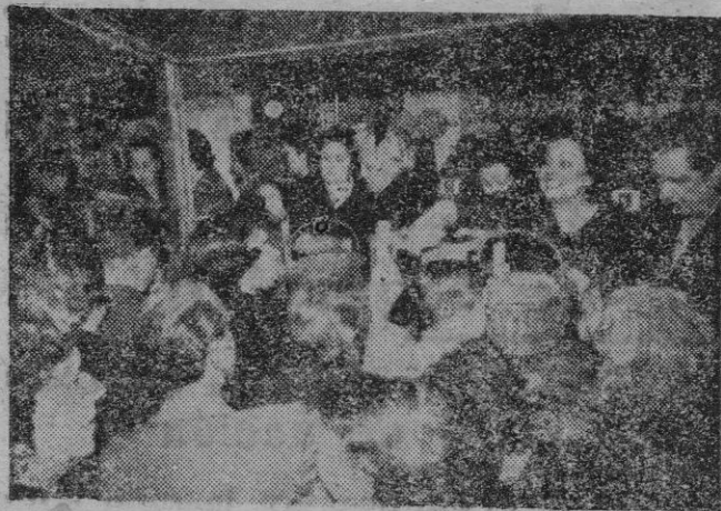
En la tarde de ayer, con asistencia de nuestras primeras autorizadas, fue inaugurada la Tómbola de Caridad. Inmediatamente y atendida por distinguidas damas y señoritas de la ciudad, comenzó a funcionar la tómbola, con mucha demanda de boletos.