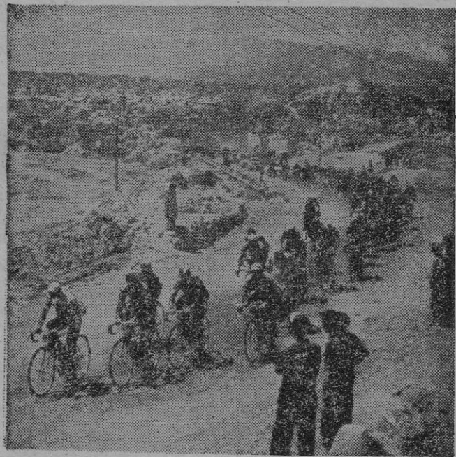
He aquí una bonita fotografía obtenida durante la V etapa de la Vuelta Ciclista a España. Los corredores avanzan con dirección a Murcia, poco después de tomar la salida en la ciudad granadina de Guadix.