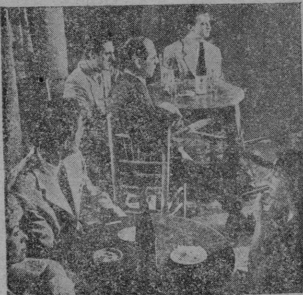
Litri, ante las cámaras de cine, precisamente para rodar la película que lleva este título: «Litri y su sombra», que ya comenzó y precisamente con una invitación a los críticos taurinos para que vieran al espada en su trabajo de cineasta.