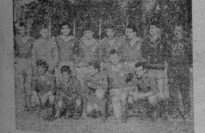
Equipo del U. D. Olot que el domingo se enfrentará al Constancia

Hoy dará por finalizado, los en el entrenador mallorquínista los jugadores concentrados bajo la vigilancia del "mister". Por la tarde llevarán a cabo los preparativos al objeto de por la noche embarcar en el buque correo de Barcelona. Estuvimos ayer tarde en el local social al objeto de averiguar si el entrenador mallorquínista había facilitado la lista de los que marchan para disputar el primer partido que ha de llevarles a la II División, frente al Sars. Se nos dijo que de momento no había lista alguna, siendo lo más probable que marchen un mínimo de 16 jugadores y que a última hora Lorenzo decida quienes han de jugar. Lo más probable es que los jugadores, a su llegada a Barcelona, sean llevados a un hotel de las afueras de la ciudad, al objeto de que se encuentren descansados al máximo ante este primer gran esfuerzo que han de llevar a cabo para salvar victoriosamente la primera eliminatoria. En una palabra que en el Real Club Deportivo Mallorca se han tomado toda clase de precauciones para que los jugadores salten al campo de la calle de Galileo en las mejores condiciones físicas y técnicas. Ahora un ruego a todos los aficionados y seguidores mallorquínistas. El equipo sale esta noche en el buque correo. Creemos que no es mucho pedir que to- (Continúa en la siguiente)