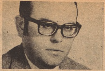
por Pedro CALVO HERNANDO

tuviéramos que ponernos todos muy circunspectos y muy-reiterativos en las tradicionales demandas. Pero en este momento no me parece muy probable que al final vaya a tener razón la prensa extranjera.