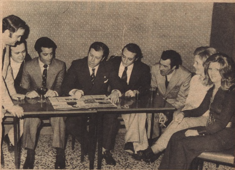
Opinan los clientes del "Bearin"

◆ LOS DIAS DE "FUTBOL GRANDE" SON TAN BUENOS COMO LOS DEL PILAR