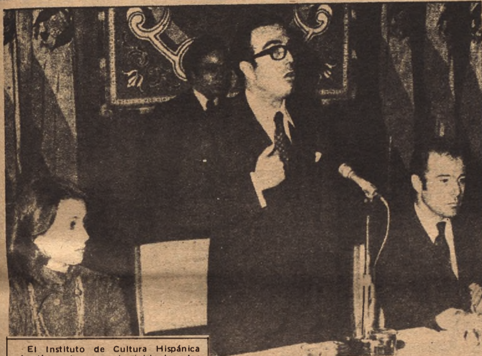
El Instituto de Cultura Hispánica ofreció un almuerzo a los asistentes a los actos conmemorativos del vigésimo quinto aniversario del Colegio Mayor Hispanoamericano Nuestra Señora de Guadalupe. Presidió el subsecretario de Información y Turismo, don Marcelino Oreja, a quien vemos en un momento de su intervención entre los duques de Cádiz.

● Camilo José Cela casi seguro presidente del Ateneo de Madrid