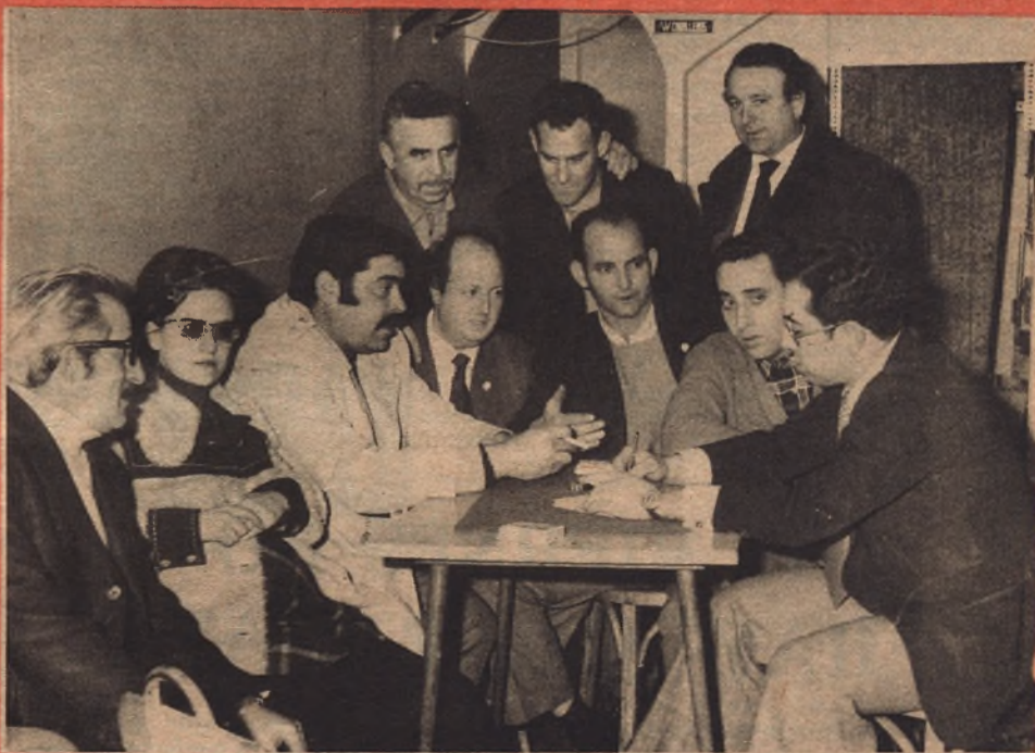
Peña de la Ciudad Jardín

◆ VEMOS ACERTADA LA ADQUISICION DE LA ROMAREDA