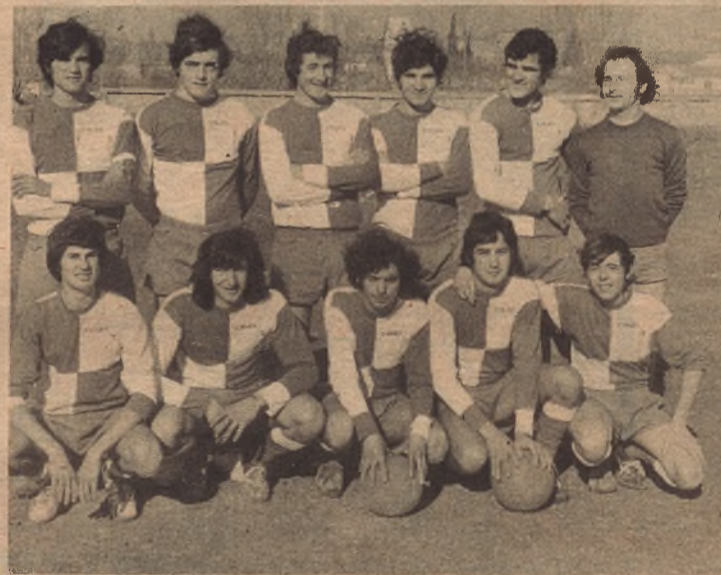
CLUB DE FUTBOL CHIAS

El domingo pasado con el fin de "matar" la mañana, desentumecer las piernas, y aprovechando que hacia un día espléndido, nos desplazamos en plan de paseo hasta la vieja Huerta de D. Sebastián - antiguo maestro nacional muy querido en Huesca que cuando murió la legó al Seminario - convertida hoy en día en popular campo de deportes