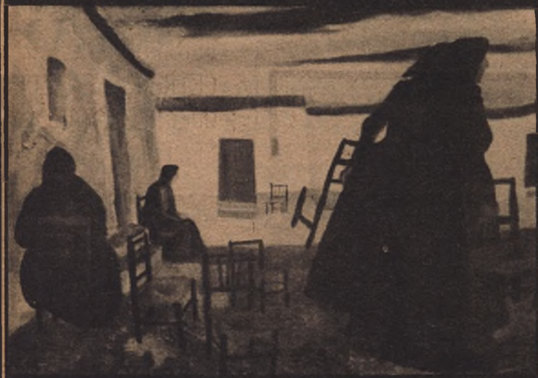
HIPOLITO.— Mujeres y sillas.