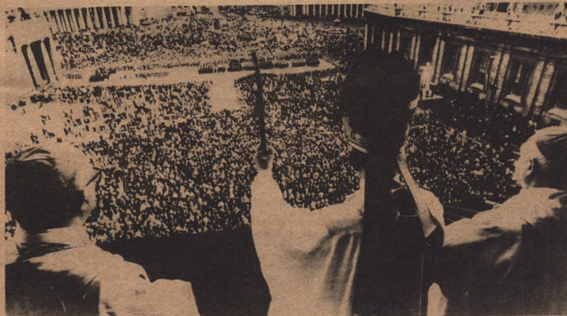
CIUDAD DEL VATICANO.— El Santo Padre el Papa Pablo VI durante la bendición Urbi et Urbi, impartida el día de Navidad a los fieles congregados en la Plaza de San Pedro y también para los que los presenciaron por televisión y escucharon por la Radio.