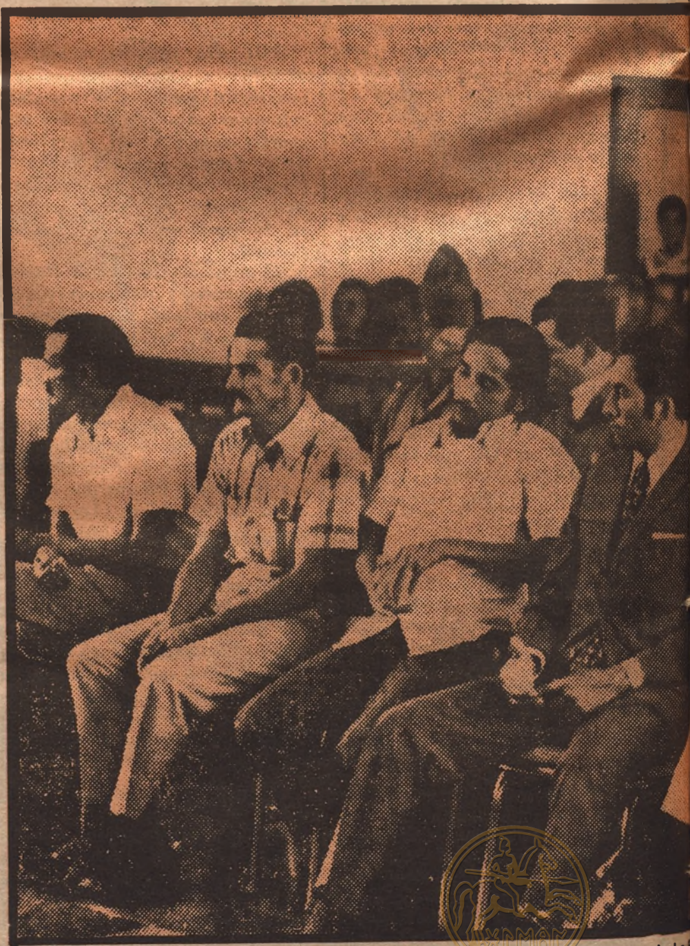
Los encausados por la matanza de La