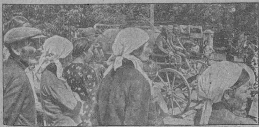
La población alemana sigue con interés y simpatía el paso de las interminables columnas alemanas que avanzan hacia el Este

dríd los periodistas y en las alquerías y villorrios las ma- rionetas aldeanas. Vosotros sabéis por vuestra experien- cia de soldados y ex comba- tientes, que la gran historia que se recoge luego en ma- nuales y en las tablas de bron- ce, es la tarea militar en que la sangre, los sacrificios y el heroísmo, son los tres ingre- dientes primeros. Todo lo de- más serán historias o a lo sumo gacetas. Contra un periodismo de gaceterillo, contra un periodismo de fo- licularios y currinches, ha ca- ído el periodismo nacional y antiliberal de la Europa con- temporánea, el periodismo de la España de Francisco Fran- co. Desde las gacetas noticie- ras y ceremoniosas, como una pájara del siglo XVIII, es esta cosa turbia y demagógica que fué la bandera de la li- berdad de prensa. Contra la independencia, contra la so- beranía del Estado se había le- vantado el "cuarto poder". El "cuarto poder", queridos ca- maradas, eran los artículos de fondo como bombas de torres, o sea la ganancia per- dística que utilizaba el chan-